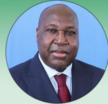
Zéphirin DIABRÉ Ministre d'Etat, Ministre auprès du Président du Faso chargé de la Réconciliation nationale et de la Cohésion sociale