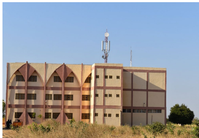
Une vue des réalisations