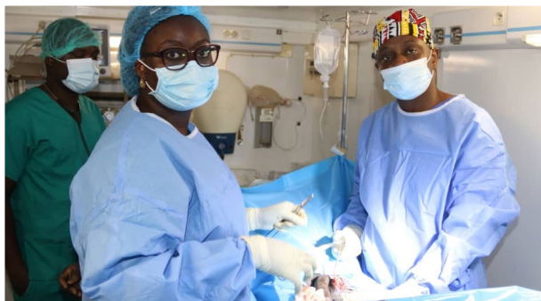
Prise en charge médical d'un patient

EMGA-Point de situation N°0075 du 29/11/2021