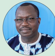
Lassané KABORÉ Ministre de l'Economie, des Finances et du Plan