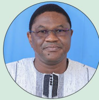
Maxime KONÉ Ministre de l'Administration territoriale, de la Décentralisation et de la Sécurité