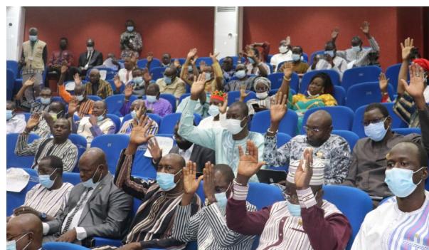
Les députés lors du vote du Budget National 2022