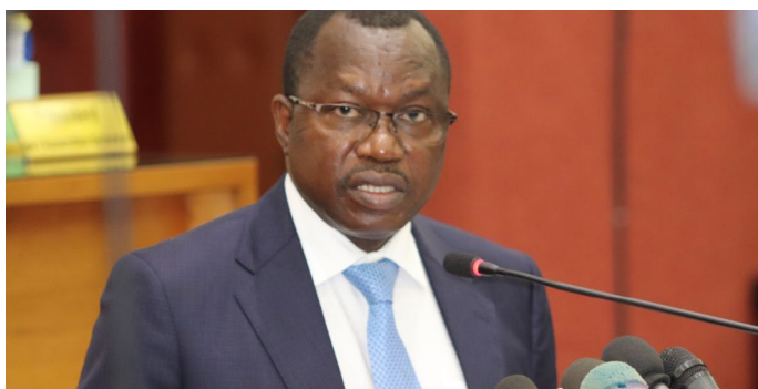
Lassané KABORE, Ministre de l'Economie, des Finances et du Plan

Au regard de la contrainte financière du moment et des nombreuses attentes légitimes des populations, les allocations budgétaires au profit des secteurs prioritaires permettront de répondre à certaines préoccupations des citoyens. Ces allocations pourraient être revues à la hausse si les niveaux de mobilisation des ressources s'améliorent en 2022.