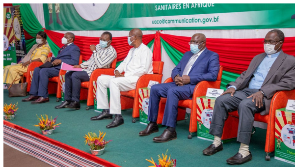
Le Présidium de la 12ème édition des UACO

relations. Ils ont également recommandé l'institutionnalisation des masters class aux UACO et la mise en place de normes idoines favorisant une saine utilisation de l'internet.