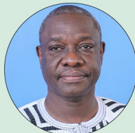
Christophe ILBOUDO Ministre du Développement industriel, du Commerce, de l'Artisanat et des petites et moyennes Entreprises