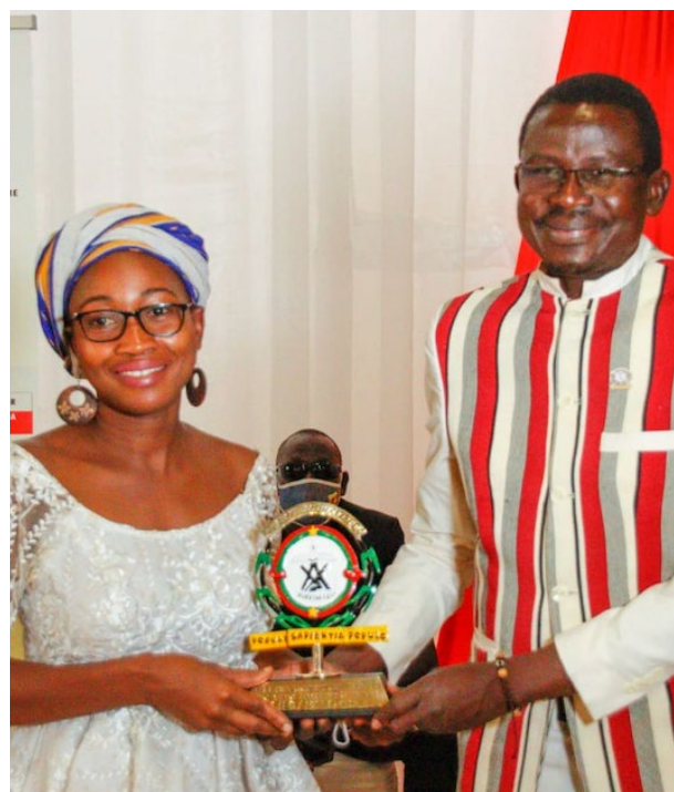
Remise de trophée à une lauréate