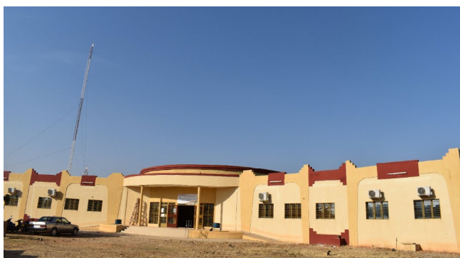
Une vue des réalisations