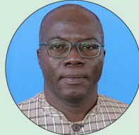
Moussa KABORÉ Ministre de l'Agriculture, de l'Aménagement hydro-agricole, de la Mécanisation, et des Ressources animales et halieutiques