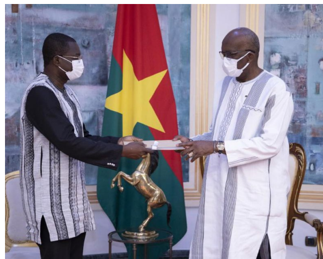
Remise du rapport sur le drame d'Inata au Président du Faso