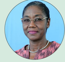
Victoria OUÉDRAOGO/KIBORA Ministre de la Justice, des Droits de l'Homme et de la Promotion civique, Garde des Sceaux