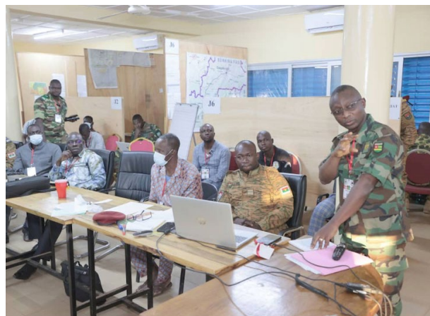
L'unité de coordination en action