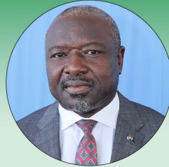
Lassina ZERBO Premier ministre, chef du Gouvernement