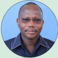
Stanislas OUARO Ministre de l'Education nationale, de l'Alphabétisation et de la Promotion des Langues nationales