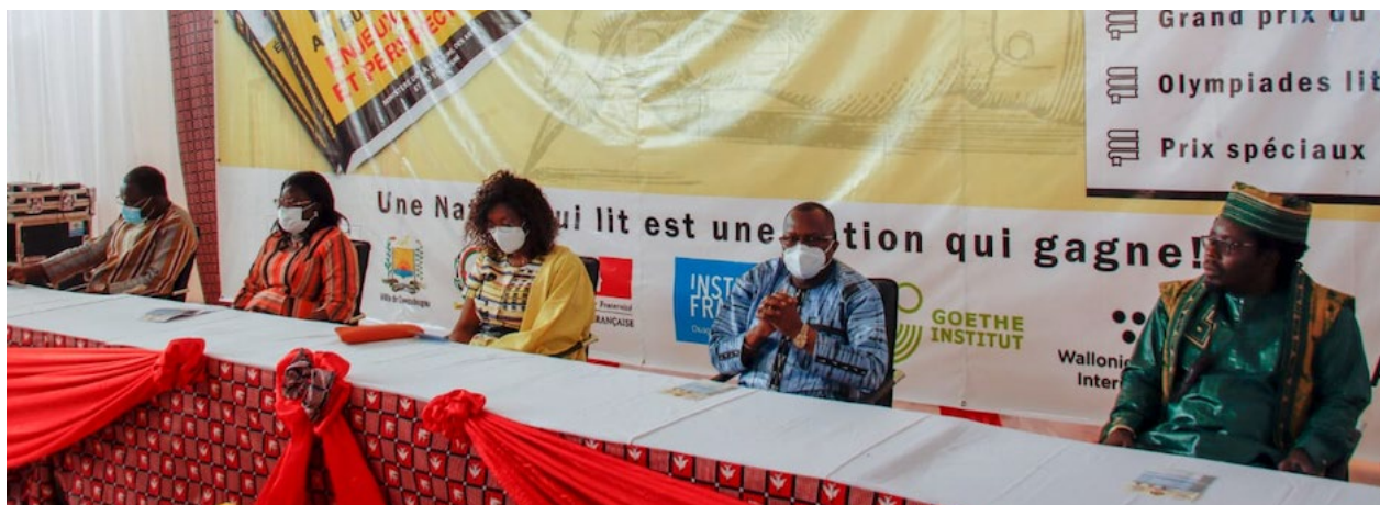
Une vue du Présidium lors de la cérémonie d'ouverture