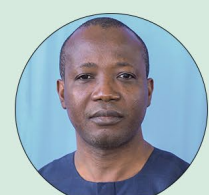
Abdoulaye BAMOGO Ministre de la Prospective et des Réformes structurelles