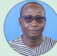
Olo Franck KANSIÉ Ministre des Infrastructures et du Développement