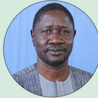
Alkassoum MAÏGA Ministre de l'Enseignement supérieur, de la Recherche, et de l'Innovation, Porte-parole du Gouvernement