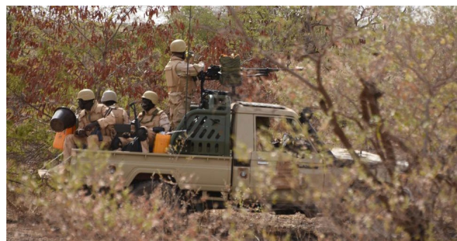
Des FDS en patrouille