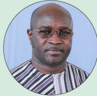
Charlemagne Marie Ragnag-Newendé OUÉDRAOGO Ministre de la Santé, de l'Hygiène publique et du Bien-être