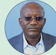
Ousmane NACRO Ministre de l'Eau et de l'Assainissement