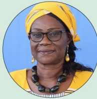
Hadizatou Rosine SORI-COULIBALY Ministre des Affaires étrangères, de la Coopération et des Burkinabè de l'extérieur