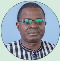
Gal Aimé Barthélémy SIMPORÉ Ministre des Armées et des anciens Combattants