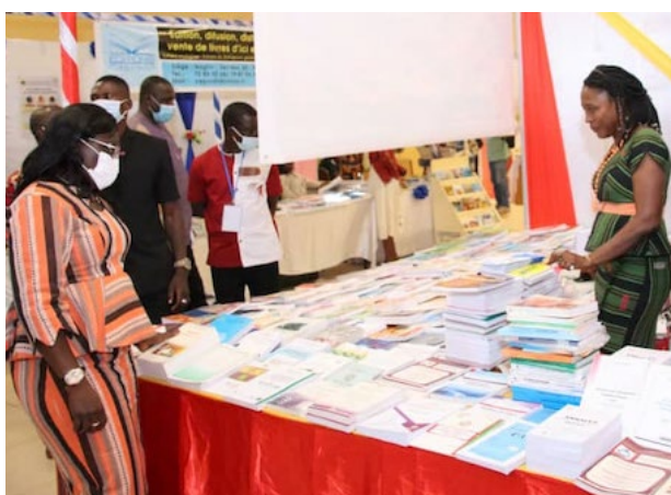
Viste de stand de Mme la Ministre en charge de la Culture, Dr ELise Foniama Thiombiono, Ministre

Rendez-vous est pris pour la 17 ème édition, du 23 au 26 novembre 2023.