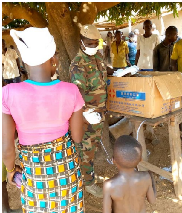
Partage de kits sanitaires aux civils