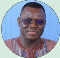
Vincent Timbindi DABILGOU Ministre des Transports, de la Mobilité urbaines et de la Sécurité routière