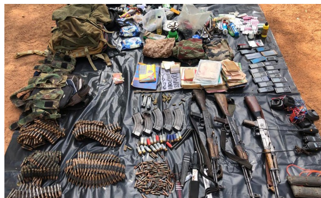
Une vue du matériel récupéré

EMGA-Point de situation N°0074 du 15/11/2021