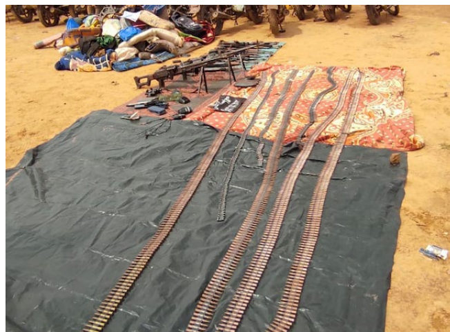
Une vue du matériel récupéré

02 novembre 2021 : Une unité des Forces Armées Nationales a intercepté et neutralisé un groupe de terroristes dans la zone de TAPOKO (Province du Houet). Ces terroristes, qui transportaient une importante logistique, ont engagé le combat lorsque l'unité a tenté de les appréhender. On dénombre 08 terroristes tués. Plusieurs Kalachnikovs, une importante quantité de munitions et de chargeurs, des motos, des engins explosifs improvisés non amorcés, des moyens de communication et divers objets personnels ont été saisis.