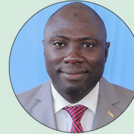
Sény Mahamadou OUÉDRAOGO Ministre de la Fonction publique, du Travail, et de la Protection sociale