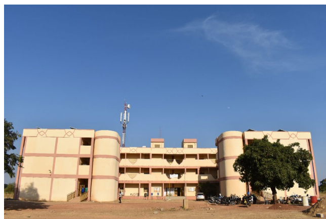
Une vue des réalisations