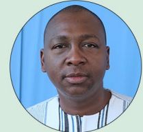
Bachir Ismaël OUÉDRAOGO Ministre de la Transition énergétiques, des Mines et des Carrières