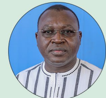
Ousséni TAMBOURA Ministre de la Communication, des Relations avec le Parlement, de la Culture, des Arts et du Tourisme