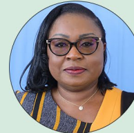
Hadja Fatimata OUATTARA/SANON Ministre de la Transition digitale, des Postes et des Communications électroniques