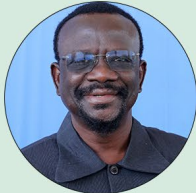
Bénéwendé Stanislas SANKARA Ministre du Développement urbain, de l'Habitat, et de la Ville