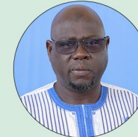
Smaïla OUÉDRAOGO Ministre de la Transition écologique et de l'Environnement