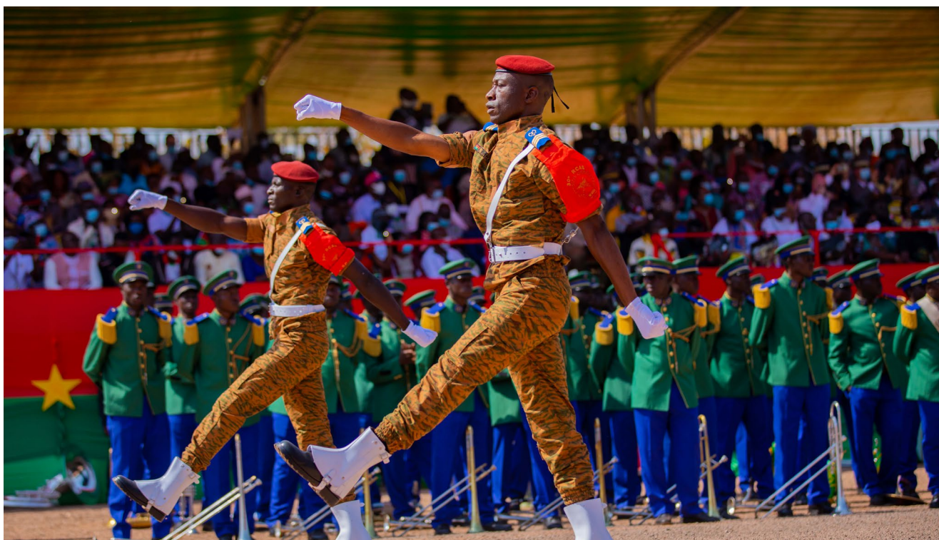
Photo d'archive du défilé du 11-Décembre

Dans son discours à la Nation à l'occasion du 61 ème anniversaire de l'indépendance du Burkina Faso, le président du Faso invite les populations à l'union sacrée, en prenant garde de ne pas tomber dans « le piège sournois de l'ennemi ». Tout en saluant la résilience du peuple burkinabè qui continue « de subir les exactions lâches des terroristes », Roch Marc Christian KABORE déclare que « le terrorisme au Burkina Faso est alimenté et entretenu par la haine née de notre histoire politique récente ». Aussi, estime-t-il, « nous devons avoir le courage de nous regarder en face pour solder tout ce passif douloureux,